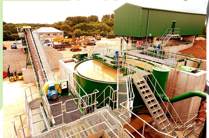
Separáčn1 a recyklační zař1zení pro SDO

Během prvního semestru vypracují partneři odpovědní za každou činnost metodiku sběru dat. Partneři poté přispějí svým sběrem dat poskytnutím informací o regionální, místní a územní statistice. Sledujte projektový zpravodaj, abyste drželi krok s výsledky výzkumu, na němž máte i Vy, jakožto klíčoví aktéři, svůj podíl!