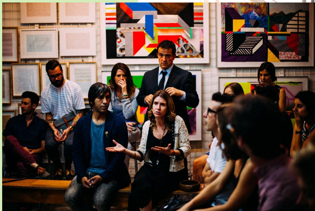
Pravidelné schůzky klíčových aktérů

Cílem je identifikovat, pozvat a zapojit všechny regionální aktéry se zájmem o správu a recyklaci SDO. Dlouhodobým cílem je, aby tyto skupiny byly konsolidovány alespoň po dobu trvání projektu. Skupiny klíčových aktérů projektu jsou zakládajícím blokem pro vyvolání změn na místní a regionální úrovni. Schůzky jsou důležité pro dosahování dohod, sdělování regulačního a legislativního vývoje, iniciativ a především vytvoření vztahů mezi klíčovými aktéry v oblasti řízení SDO.